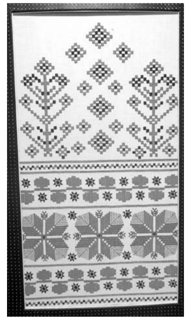
Siuvinėti rankšluosčiai – neatsiejama ukrainiečių liaudies kultūros dalis.