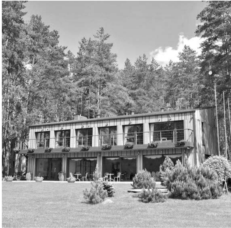
Už šiuolaikinį kaimo turizmo kompleksą Andrioniškio seniūnijoje, prie Šventosios upės, prašoma 540 tūkst. eurų.

Vilniaus gatvėje prie pat kelio esantį medinį namą Šimkai pernai perstatė. Šis pastatas, kuriame anksčiau veikė laidojimo prekių parduotuvė, tarytum prakeiktas - daugelį metų buvo laukta leidimo rekonstrukcijai, o galų gale jį rekonstravus Šimkai po septynių mėnesių gavo „Ignitis“ atsakymą, kad į namą negalima įvesti dujų. „Parašėme prašymą, sumokėjome pinigus. Kantrai laukėme. Galų gale at-