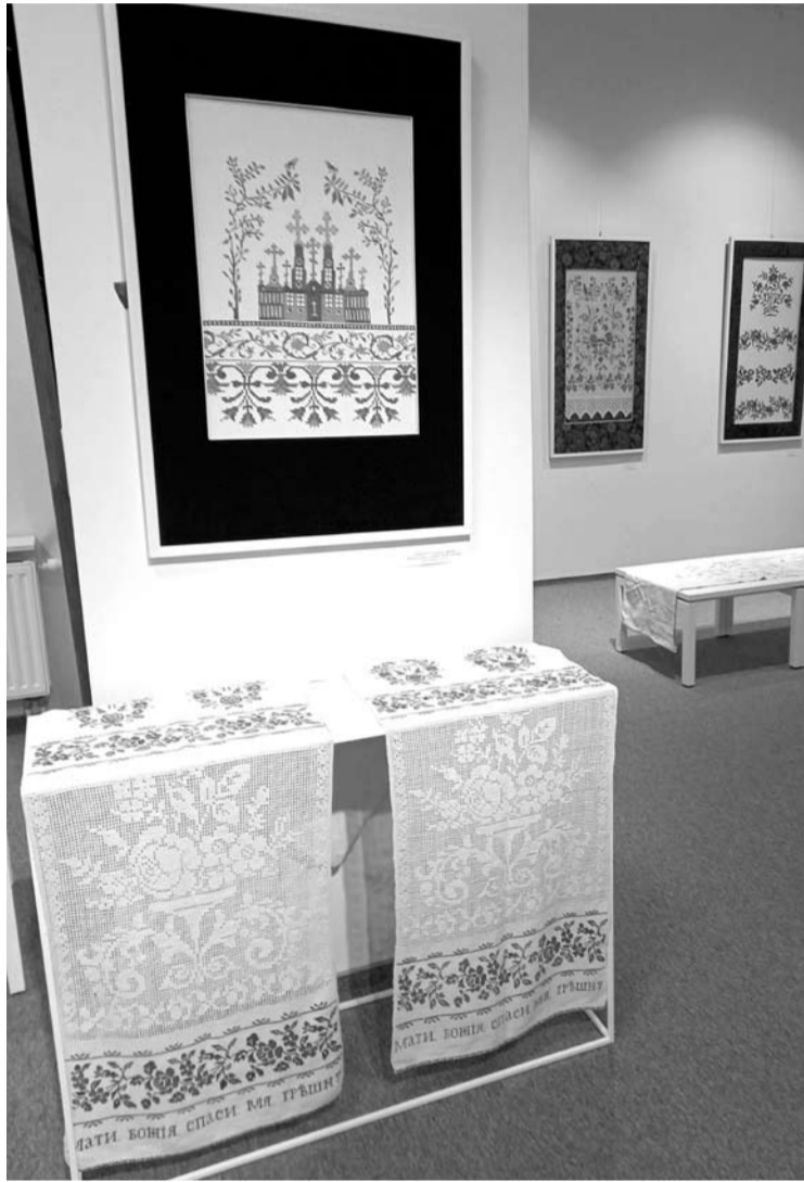
Parodoje „Sakraliniai simboliai Ukrainos liaudies tekstilėje“ eksponuojami tradiciniai XIX a. pab. - XX a. pr. siuvinėti rankšluosčiai.

Trečiadienį, rugpjūčio 4 dieną, 18 valandą centre rengiamas parodos pristatymas.